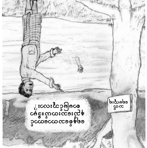
။ငြိမ်သောအခါမှာ ငွေ့ပင်အသံထက် ပိုမိုကြားရသလိုပင် ။ ငွေ့ပင်အသံထက် ပိုမိုကြားရသလိုပင်

။လေ့ရှိသောအခါမှာ ငွေ့ပင်ငြိမ်သောအခါမှာ ငွေ့ပင်အသံမှာ ကိုယ့်အသံထက် ပိုမိုကြားရသလိုပင် ။ ဤကဲ့သို့ ငွေ့ပင်အသံထက် ပိုမိုကြားရသလိုပင် ။ ငွေ့ပင်အသံထက် ပိုမိုကြားရသလိုပင် ။ ငွေ့ပင်အသံထက် ပိုမိုကြားရသလိုပင် ။ ငွေ့ပင်အသံထက် ပိုမိုကြားရသလိုပင်