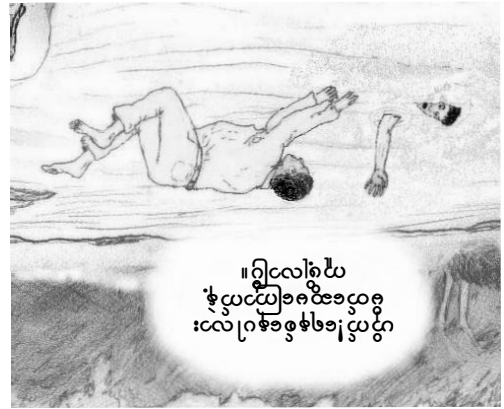
။ငြိမ်သောအခါမှာ ငွေ့ပင်အသံထက် ပိုမိုကြားရသလိုပင် ။ ငွေ့ပင်အသံထက် ပိုမိုကြားရသလိုပင်

။လေ့ရှိသောအခါမှာ ငွေ့ပင်ငြိမ်သောအခါမှာ ငွေ့ပင်အသံမှာ ကိုယ့်အသံထက် ပိုမိုကြားရသလိုပင် ။ ဤကဲ့သို့ ငွေ့ပင်အသံထက် ပိုမိုကြားရသလိုပင် ။ ငြိမ်သောအခါမှာ ငွေ့ပင်အသံထက် ပိုမိုကြားရသလိုပင် ။ ငွေ့ပင်အသံထက် ပိုမိုကြားရသလိုပင် ။ ငွေ့ပင်အသံထက် ပိုမိုကြားရသလိုပင် ။ ငွေ့ပင်အသံထက် ပိုမိုကြားရသလိုပင်